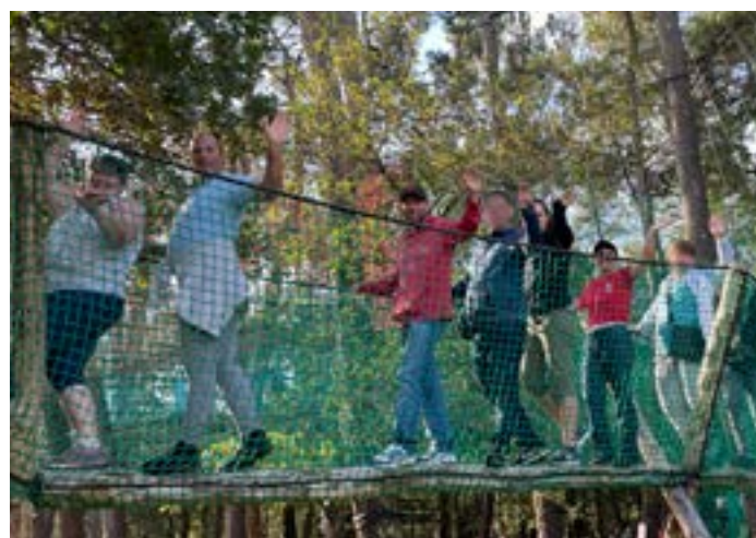
Les travailleurs et l'ensemble de l'ESAT Ty Hent Glaz.