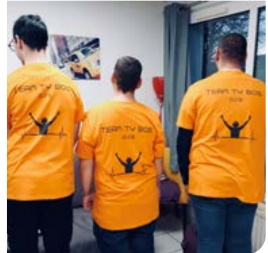
La Team Ty Bos DJ's

Nous sommes déjà intervenus au foyer de Rosporden à deux reprises et à celui de Plomelin. À très vite sur le Dancefloor!