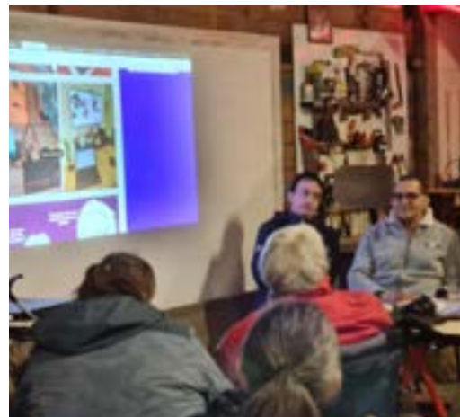
Restitution des résidents à « La Baleine ».