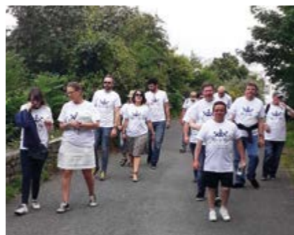
Les participants à cette opération conviviale.