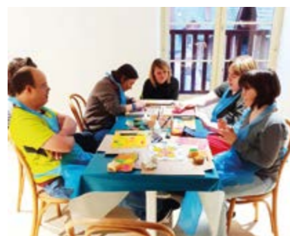
Les résidents en création au domaine de Trévarez.