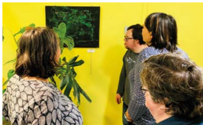
Présentation des œuvres à l'occasion du vernissage début décembre.

Du 6 janvier au 3 février 2020, l'exposition « des caresses aux émotions » proposée et réalisée par les usagers de l'accueil de jour de Douarnenez sera une nouvelle fois présentée au siège de l'association.