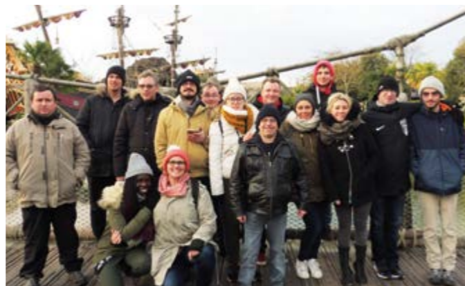
Les résidents de l'UVE accompagnés de leurs éducatrices.

« Convivial, agréable et bien organisé, j'ai adoré, j'en garde un super souvenir », Maxime.