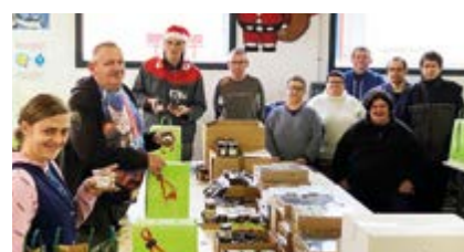
L'atelier de sous-traitance de l'ESAT de Douarnenez a réalisé les compositions cadeaux 2019 pour le comité d'entreprise de Kan Ar Mor.