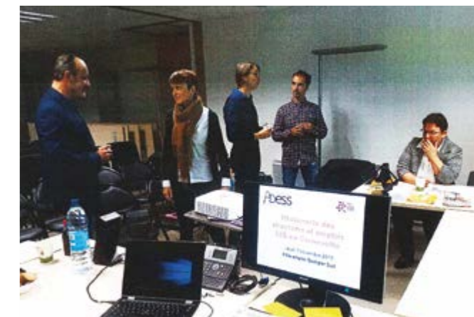
Les partenaires de l'emploi.