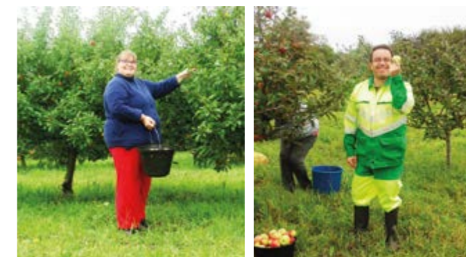
Tous les ans à lieu la cueillette des pommes. Moment de rencontre et de retrouvailles entre les travailleurs des ateliers alternés et l'association APEI.