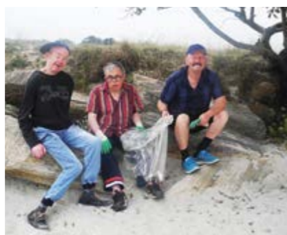
Les résidents sur une plage de la Forêt-Fouesnant.

En partenariat avec l'association ANSEL (Association de nettoyage au service de l'environnement et du littoral), les résidents du Foyer de vie de Kernével participent à des opérations de ramassage des déchets sur les plages Finistériennes.