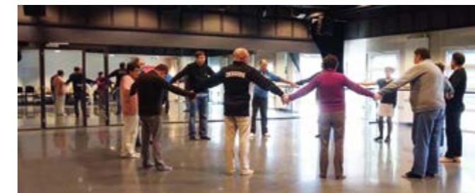
Les artistes en préparation du spectacle.