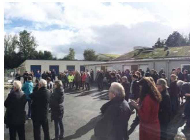
Les usagers, salariés et partenaires venus nombreux.

Pour cette opération de restructuration, l'ensemble des locaux est concerné avec la création d'un espace supplémentaire de 140 m 2 . Enfin, l'isolation du bâtiment et l'installation de chauffage seront améliorées afin de rationaliser la consommation en énergie. ■