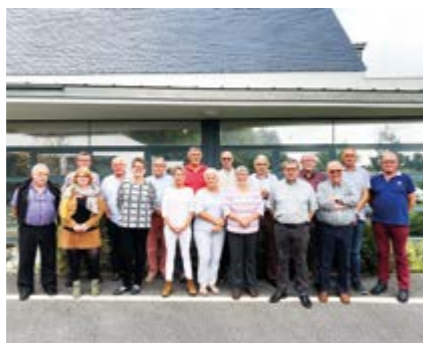
Les membres du Conseil d'administration.