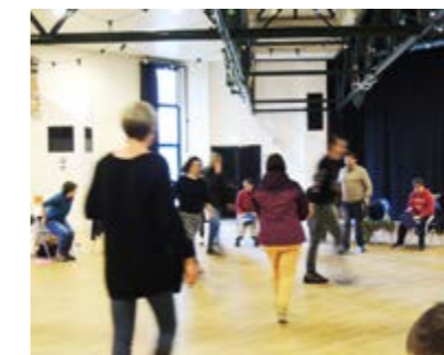
Atelier en préparation.