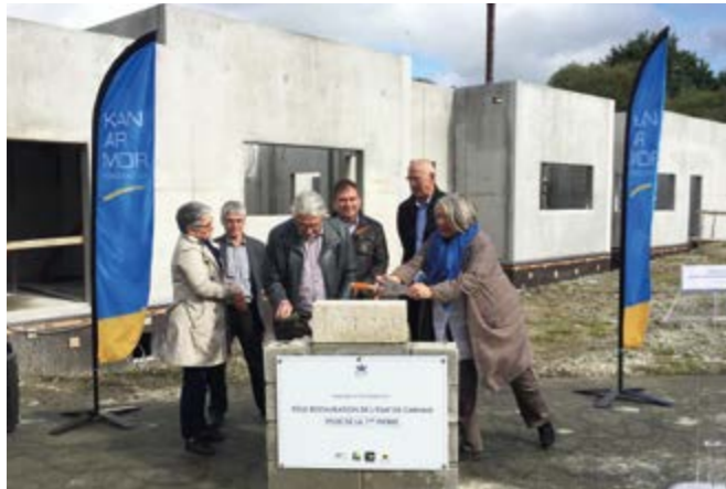
Les élus et représentants ont procédé à la pose de la 1 ère pierre.

Environ 80 personnes ont assisté, le 9 octobre dernier, à la pose de la 1 ère pierre du futur pôle restauration de Carhaix. Officiels, entreprises, personnels et travailleurs d'ESAT étaient présents à l'occasion de cet événement.